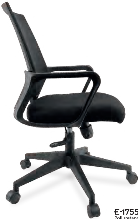
E-17551 INY Poliuretano Inyectado